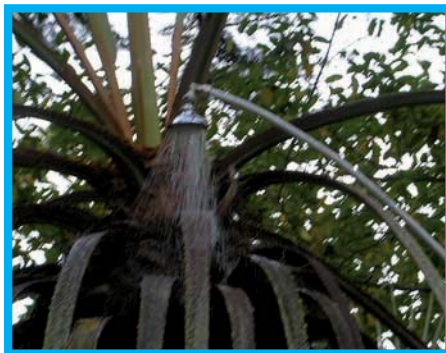
Trattamento con doccia