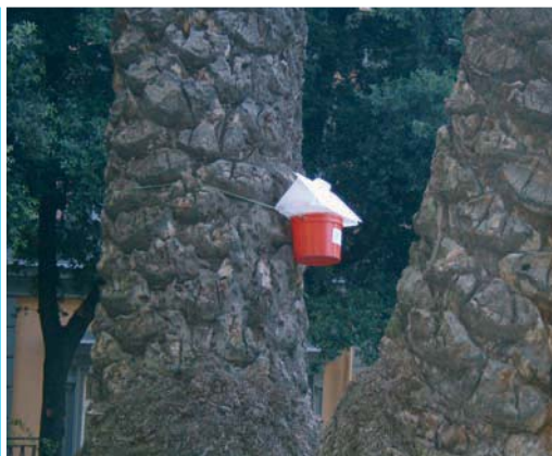
Trappola attrattiva per il monitoraggio della presenza del punteruolo