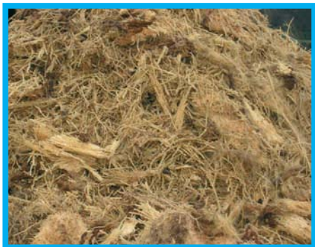
Tronco di palma dopo la cippatura