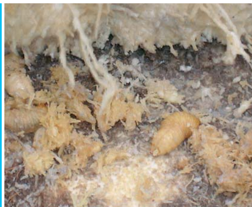
Diverse larve che si nutrono del tessuto interno della palma